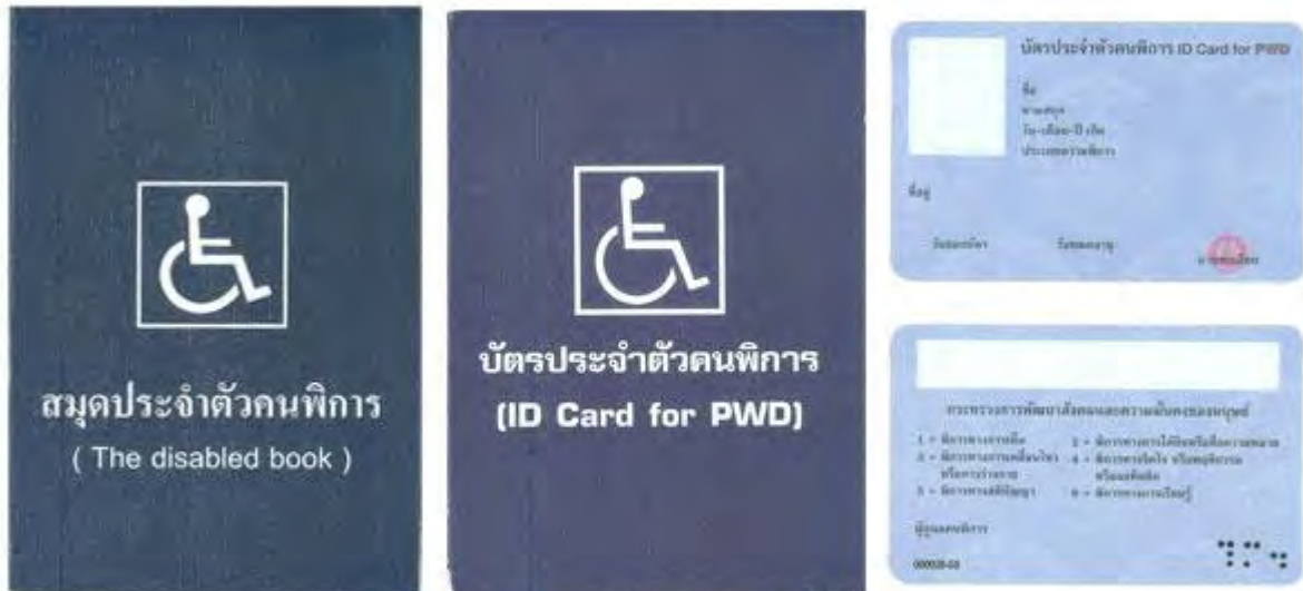
ตัวอย่างบัตรและสมุดประจำตัวคนพิการ

หมายเหตุ กรณีได้รับเบี้ยยังชีพคนพิการอยู่แล้ว และได้ย้ายเข้ามาในพื้นที่องค์การบริหารส่วนตำบลห้วยปูลิง จะต้องมาขึ้นทะเบียนที่องค์การบริหารส่วนตำบลห้วยปูลิง ภายในเดือนที่ย้ายภูมิลำเนา เพื่อใช้สิทธิรับเงินเบี้ยความพิการต่อเนือง